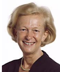
Nicole Fontaine – ancienne présidente du parlement européen, ancienne ministre, professeure à ESCP Europe et avocate spécialisée en droit de l'Union européenne