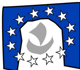
Maison de l'Europe de Paris

Génération Europe est hébergée par la Maison de l'Europe de Paris qui est son partenaire institutionnel permanent.