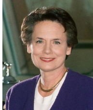
Catherine Lalumière – présidente de la Maison de l'Europe de Paris, ancienne secrétaire générale du Conseil de l'Europe, ancienne ministre et vice-présidente du Parlement européen