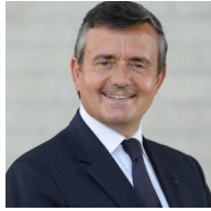
Yves Jégo – ancien ministre, député, directeur de la dernière campagne des élections européennes UDI-MODEM